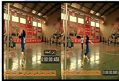
الشكل (5) يوضح قياس متغير مسافة وزمن وسرعة الخطوة الأخيرة الشكل (6) يوضح قياس زمن الاستناد