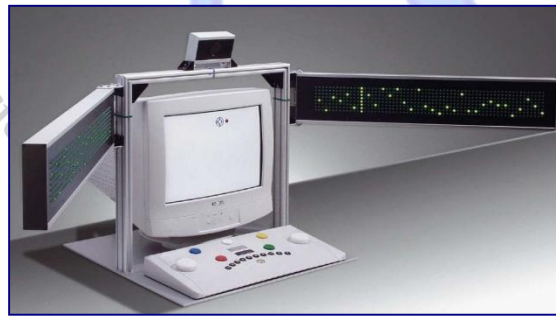
شكل (1) يوضح الجهاز الرئيس لاختبار إدراك المحيط.

وتم تصميم هذا الاختبار لتقييم إدراك ومعالجة المعلومات المرئية الخارجية إذ يعد الإدراك البصري الجيد ضرورة بالنسبة للعديد من الفعاليات التي يمارسها البشر والآلات معا وخاصة في المجال الرياضي.