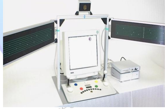
الشكل (4) يوضح إحدى المفحوصات ضمن عينة البحث وهي تقوم بتطبيق اختبار التركيز البصري