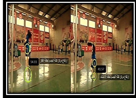
الشكل (7) يوضح طريقة القياس الشكل (8) يوضح طريقة قياس مسافة وزمن وسرعة انطلاق الكرة