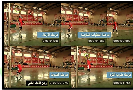
الشكل (9) يوضح طريقة القياس .