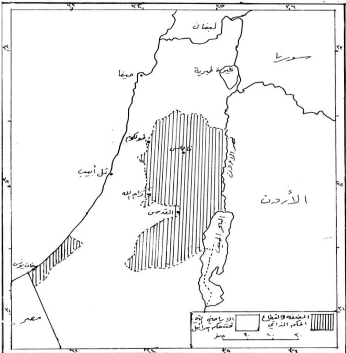
شكل (٢) مناطق الحكم الذاتي الفلسطيني والأراضي الواقعة تحت سيطرة إسرائيل