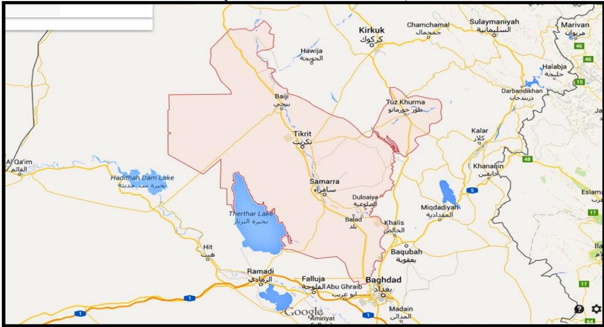
جدول ( 2 ) : مدى ومعدل القيم الهيدروكيميائية لنماذج مياه الابار في منطقة الدراسة للعام 2013 .